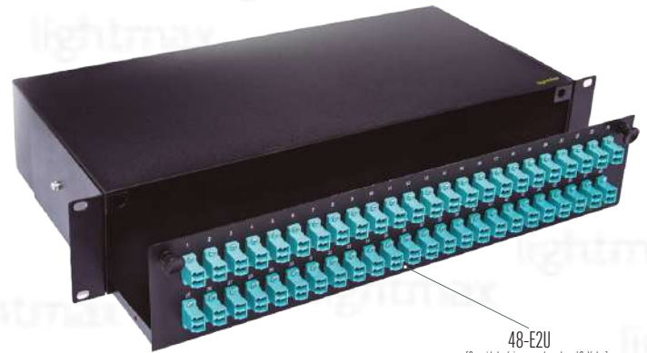
48-E2U [Capacidad máxima con adaptadores LC dúplex]

[Imágenes únicamente con fines de referencia]