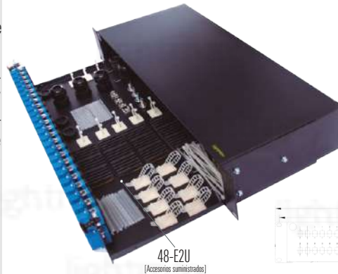
48-E2U [Accesorios suministrados]

[Imágenes únicamente con fines de referencia]